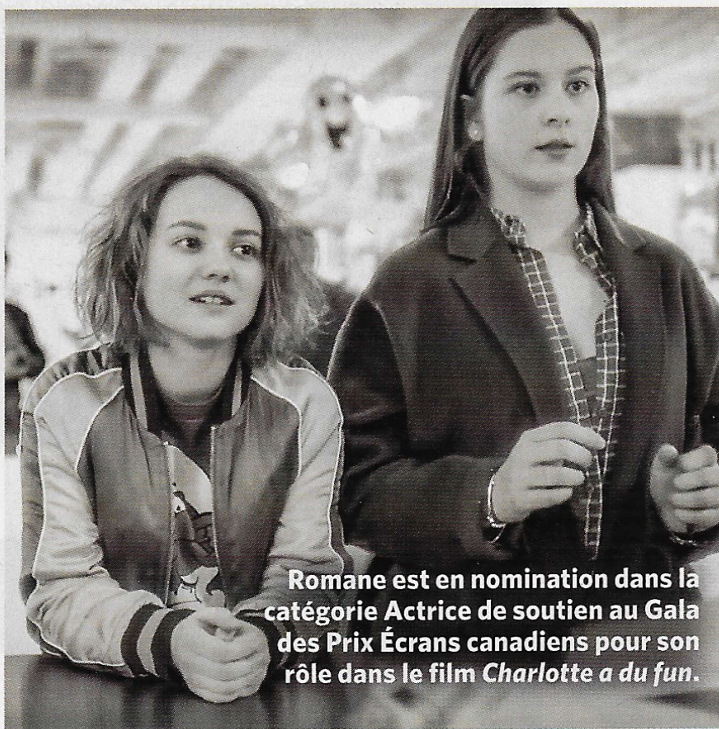
Romane est en nomination dans la catégorie Actrice de soutien au Gala des Prix Écrans canadiens pour son rôle dans le film Charlotte a du fun .

Non, je déteste les films d'horreur! Je n'en écoute pas, je n'aime pas ça, je ne vois pas pourquoi je paierais pour avoir peur. C'est un truc que je ne comprends pas. J'ai par contre l'impression qu'en faisant ce film-là, je vais en découvrir tellement plus sur la culture