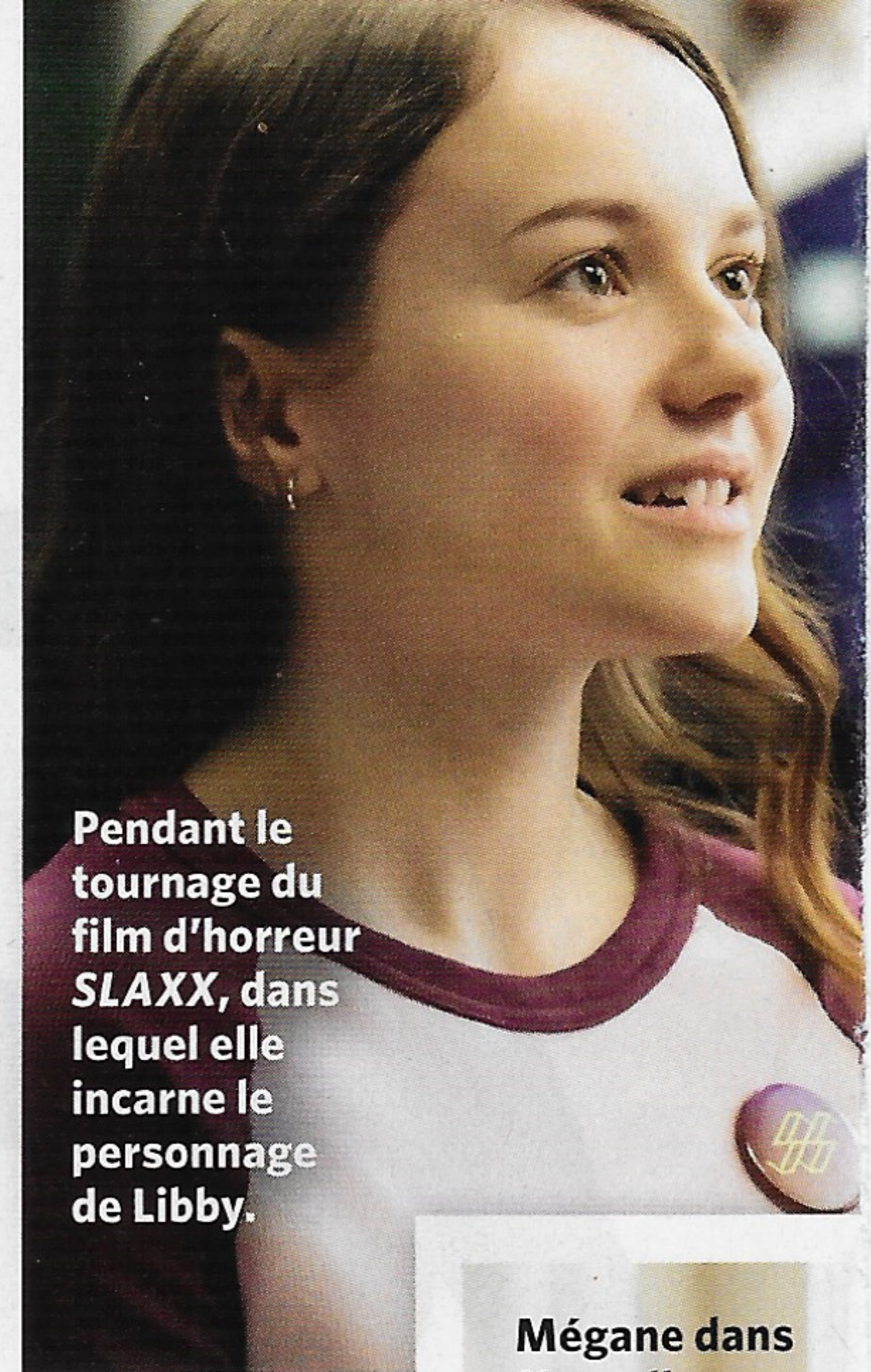
Pendant le tournage du film d'horreur SLAXX , dans lequel elle incarne le personnage de Libby.