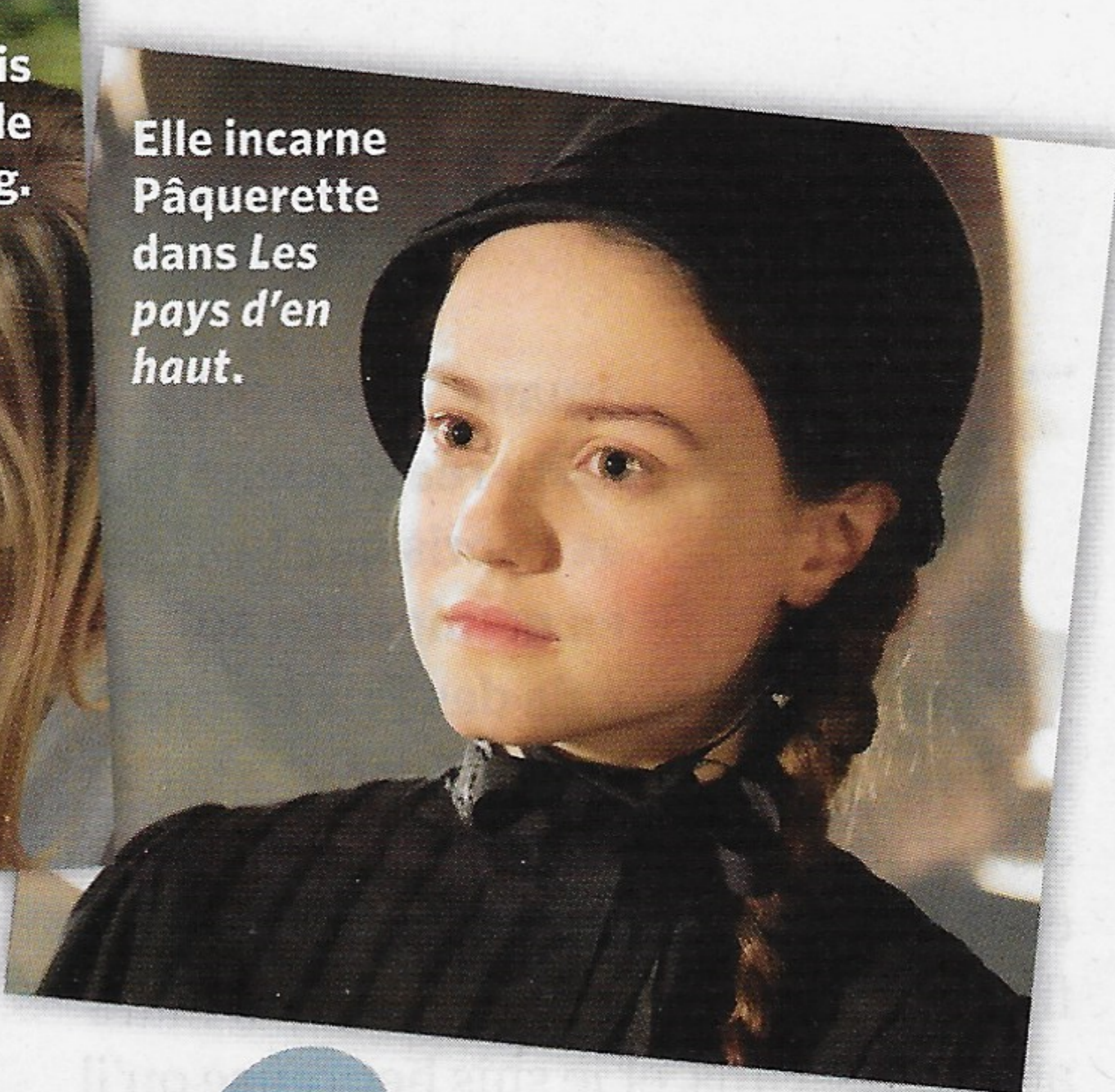
Elle incarne Pâquerette dans Les pays d'en haut .