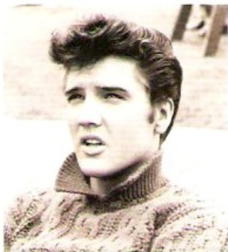
J'AIMERAIS ÊTRE BEAU COMME... ... Elvis!