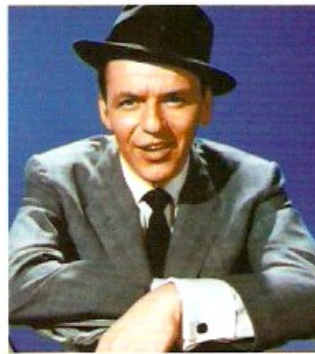
À PART MOI, J'AIMERAIS ÊTRE... ... Frank Sinatra