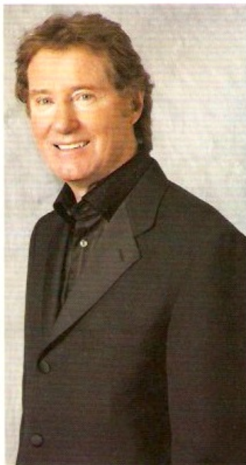
L'ACTEUR LE PLUS DRÔLE AVEC QUI J'AI TRAVAILLÉ: Marc Messier