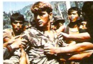
J'AURAIS AIME JOUER DANS CE FILM: Apocalypse Now , avec Martin Sheen