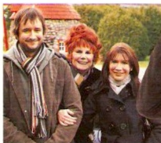
LE DERNIER FILM QUE J'AI VU AU CINÉMA: