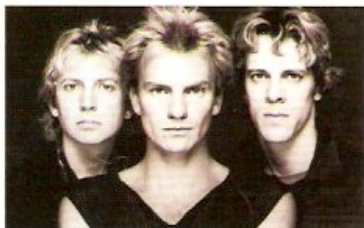
MON GROUPE-CULTE DE JEUNESSE: The Police

Le dernier concert que j'ai vu: Celui de Black Rebel Motorcycle Club