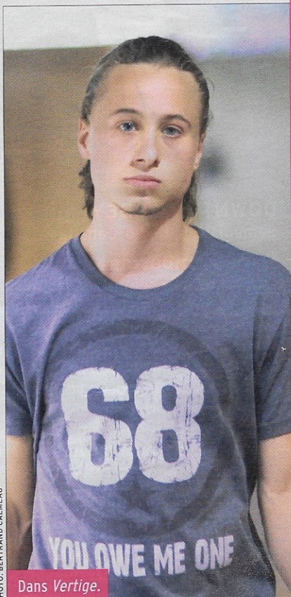
Dans Vertige .

Je suis fou de cinéma et je n'ai pas eu la chance d'en faire beaucoup depuis l'époque d' Idole instantanée . J'aimerais non seulement jouer dans un film, mais aussi écrire ou réaliser. Les milieux de la télé et du cinéma m'intéressent beaucoup.