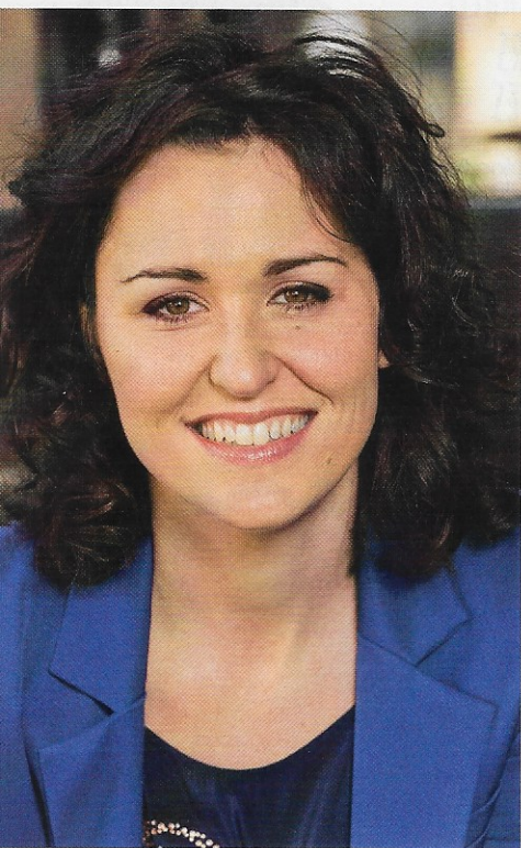
Sa mère, la comédienne Tammy Verge